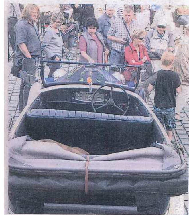
Ein Mal mit solch einem Cabrio eine Spritztour machen...