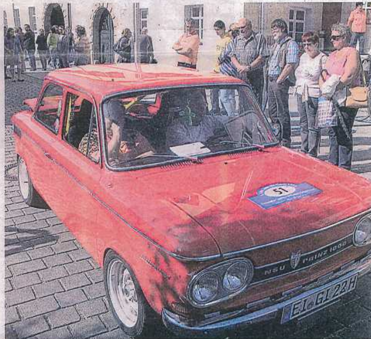
Auch dieser NSU präsentierte sich in einem hervorragenden Zustand.