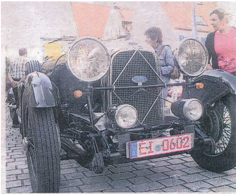
Die Autos von früher hatten noch ein „Gesicht“, wurde allgemein festgestellt.