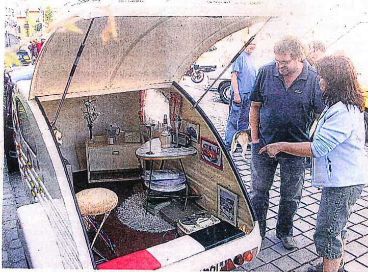
Ist er nicht süß, der Anhänger mit dem passenden Namen „Piccolino“?

Erfolgreiche Premiere der Oldtimer-Veranstaltung Franz Xaver Uhl Classic