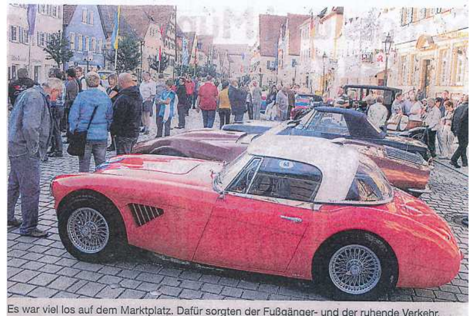
Es war viel los auf dem Marktplatz. Dafür sorgten der Fußgänger- und der ruhende Verkehr.