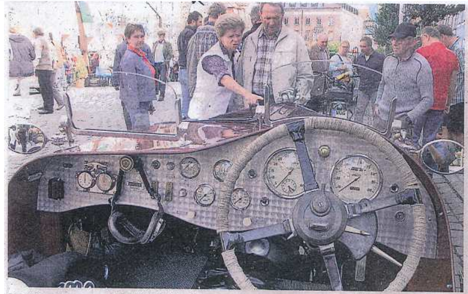
Das Wageninnere und die tollen Kühlerfiguren zogen das besondere Interesse auf sich.